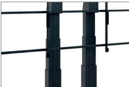
Motorisch höhenverstellbar - 700 mm Hub

Neben den vorkonfigurierten Systemen bietet HAGOR kundenspezifische Sonderlösungen im LED-Bereich an, welche abgestimmt auf alle Bedürfnisse mit Zubehör wie z. B. Lautsprechern, Steuerungen etc. individualisiert werden können.