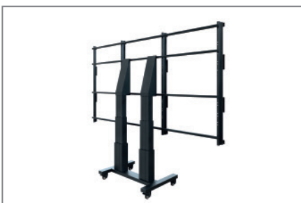
Kein Fineadjustment notwendig